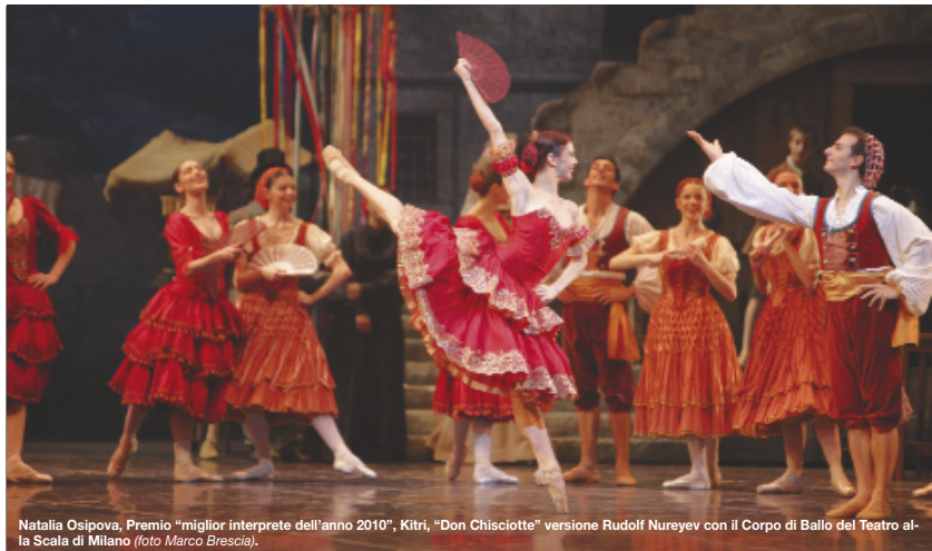
Natalia Osipova, Premio "miglior interprete dell'anno 2010", Kitri, "Don Chisciotte" versione Rudolf Nureyev con il Corpo di Ballo del Teatro alla Scala di Milano.