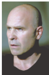
Virgilio Sieni

Autore sempre teso verso l'inafferrabile, immerso in una costante sfasatura, Virgilio Sieni cattura pienamente la parte oscura del nostro tempo. Contemporaneo e 'destrutturatore', Sieni ha azzerato il codice per ricostruirlo, condensando la sua arte coreografica in una forza creativa che annienta il gesto per ritrovarlo.